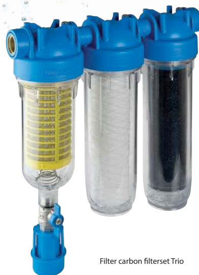
Filter carbon filterset Trio

Fijnfilter filtert de uiterst kleine deeltjes uit het water. Het filterpatroon is demontabel en zeer eenvoudig te reinigen of te vervangen, voorzien van terugslagklep. Filter is snel en eenvoudig te inspecteren via transparant, UV-dichte slagvaste filterbehuizing. Specificaties Fijnfilter 3/4" Maximale debiet: 3.000 L/h, fijnheid: 50 micron, Nominale werkdruk 10 bar, max. Temperatuur 60 graden celsius. Specificaties Fijnfilter 6/4" Maximale debiet: 4.000 L/h, fijnheid: 80 micron, Nominale werkdruk 16 bar, max. Temperatuur 40 graden celsius.